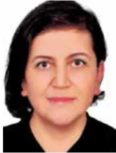
Kader ER Sekreter